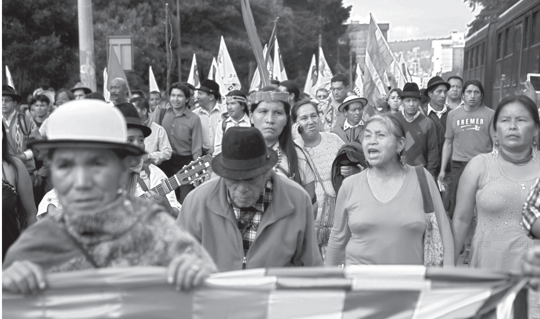
América Latina se convierte en punta de lanza de un nuevo ciclo mundial de protesta y resistencia anticapitalista. Protesta del movimiento radical indígena Conaie, Ecuador.

de una sociedad dividida en clases. En este sentido, son múltiples las contribuciones que el Movimiento Zapatista ha hecho al pensamiento crítico a nivel planetario. Como se desprende del análisis de Marx sobre la Comuna de París, 2 las transformaciones revolucionarias no son algo que se pueda derivar exclusivamente de la reflexión teórica: se nutren en específico de las experiencias de los movimientos populares y de su sistematización en un proceso dialéctico de aprendizaje.