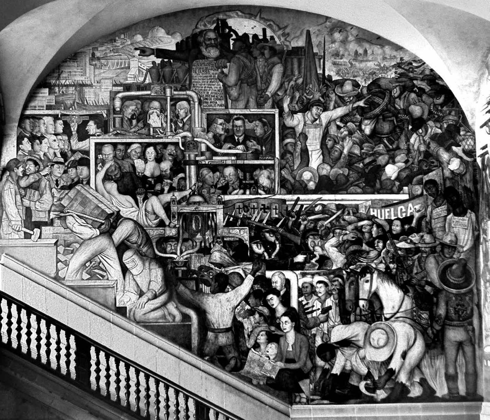
Mural El México de hoy y mañana , de Diego Rivera en Palacio Nacional de la Ciudad de México.

permitió el desarrollo de un capitalismo nacional, en sus etapas industrial y financiera, bajo la égida del presidencialismo, con la ayuda del partido hegemónico, auténtica piedra de toque del modelo local. 1