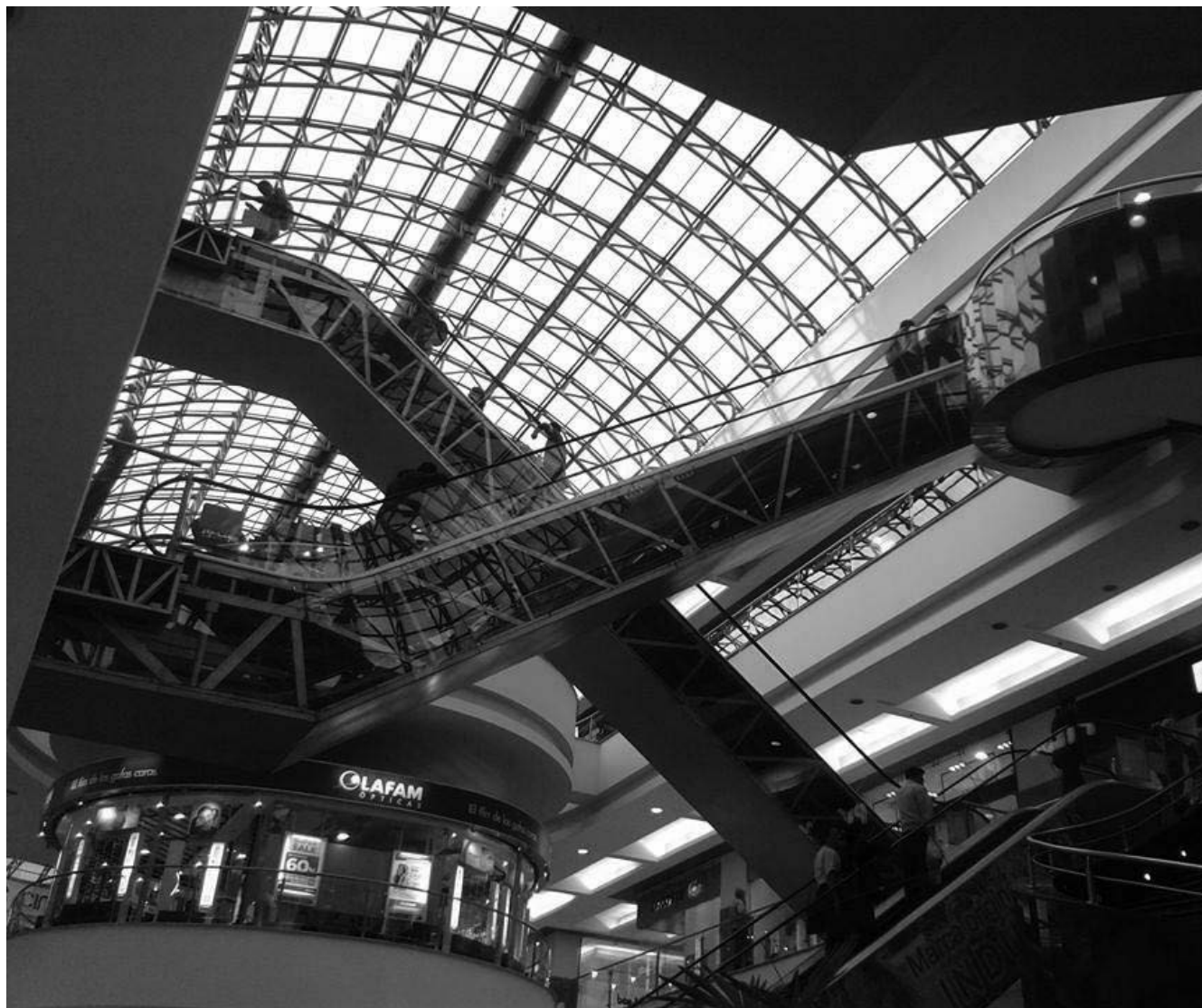
El centro comercial es el punto de reunión de la urbanidad de la modernidad tardía para consumidores solventes.

atraer a las empresas. Los centros se pueden formar donde tengan accesibilidad a mercados e insumos de una manera menos costosa. 14