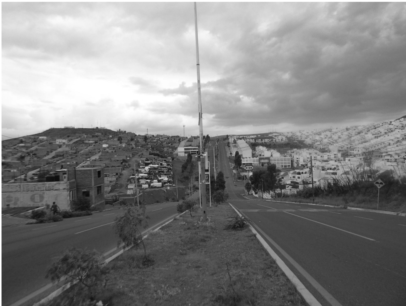
División socioespacial de clases sociales por espacios habitacionales e infraestructura urbana.

sencia de las policías federales en los estados y municipios. Bajo esta estrategia, que ha nutrido el discurso oficial, se identificó a un enemigo público, los cárteles de la droga, y se empeñaron grandes recursos presupuestales y humanos para emprender una confrontación armada, cuyo saldo ha sido catastrófico si se considera el incremento de asesinatos, desaparecidos, desplazados y el cúmulo de personas y comunidades que viven amenazados o amedrentados.