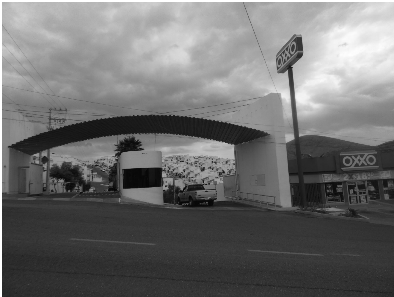
Zonas habitacionales como espacios comerciales prefabricados.

nizado adquiere una dimensión transnacional en la comisión de una gran cantidad de delitos, la respuesta se encuentra en las prescripciones de la Convención de Palermo.