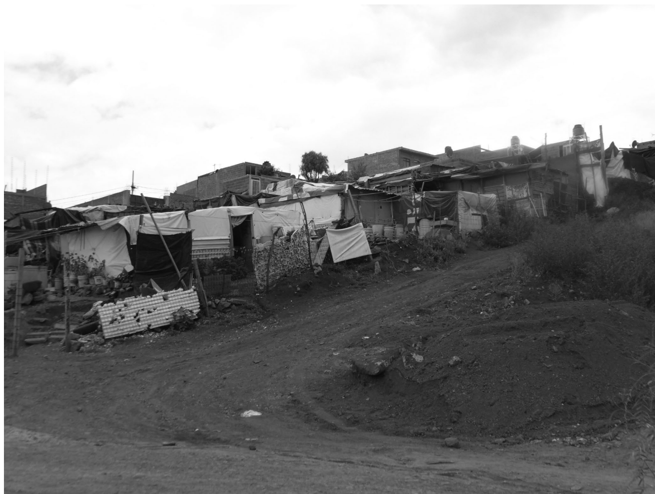
Vivienda precaria en colonia periférica de la ciudad de Zacatecas.

En este contexto, las principales prescripciones para afrontar esta problemática como alternativa a la política del Estado mexicano resultan insuficientes y limitativas por dejar de lado la necesidad de emprender cambios estructurales en la organización socioeconómica y sistema político, sólo ofrecen variantes para afrontar la oleada de violencia armada. Una de estas posturas, de corte garantista, propone una serie de medidas que parten del supuesto de la existencia o reconstrucción del Estado de derecho. 3 Desde una perspectiva neoliberal, se proponen medidas como la legalización de las drogas para aminorar el componente armado y violento. 4 Desde el lado de las víctimas, el Movimiento por la Paz con Justicia y Dignidad, encabezado por Javier Sicilia, plantea resarcir los daños a las víctimas y moralizar a las instituciones para impulsar la seguridad ciudadana. Desde una óptica internacional, Edgardo Buscaglia 5 plantea que el crimen orga-