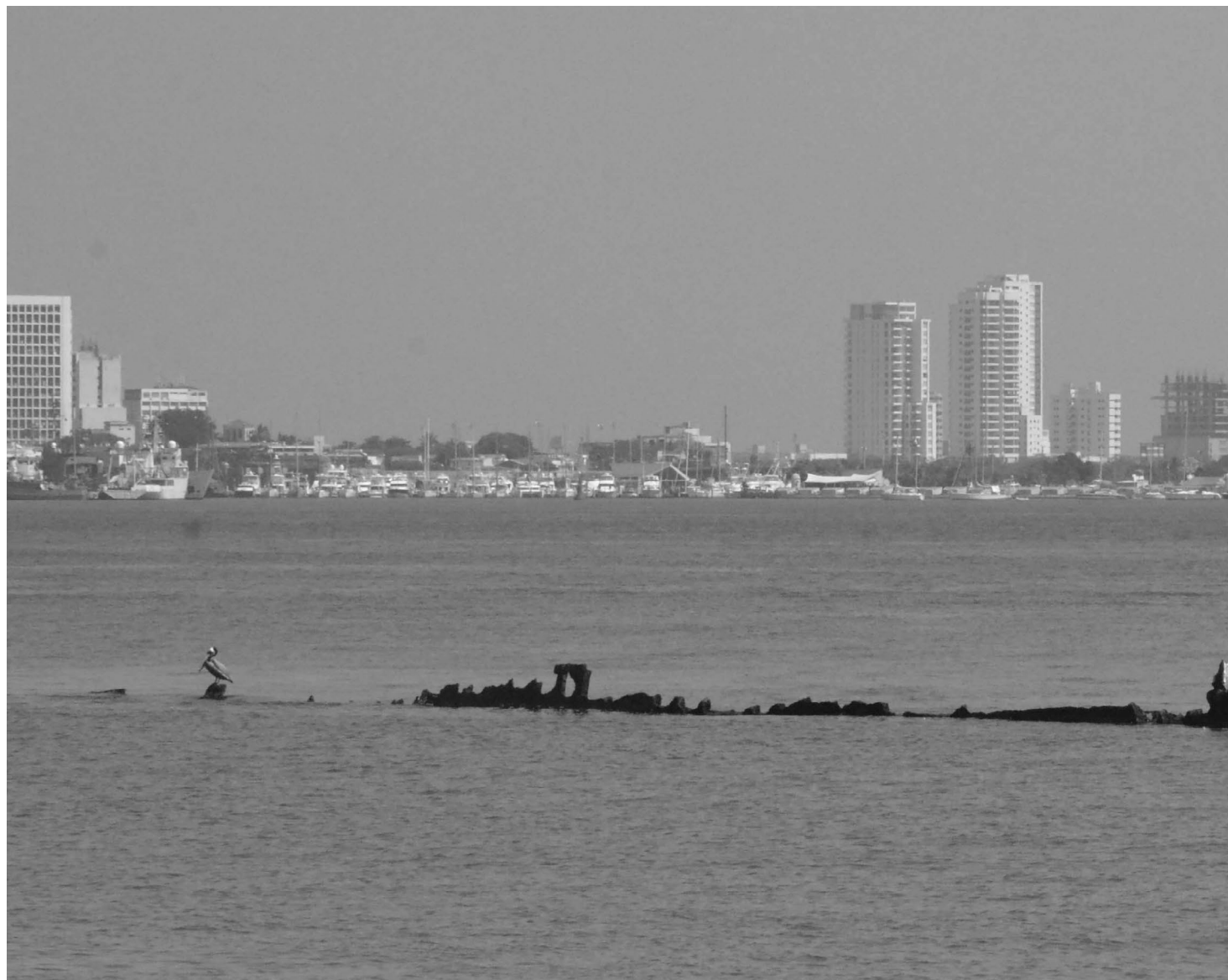
Las zonas hoteleras conectadas a los circuitos del turismo global ofrecen esparcimiento a vacacionistas con poder de compra.