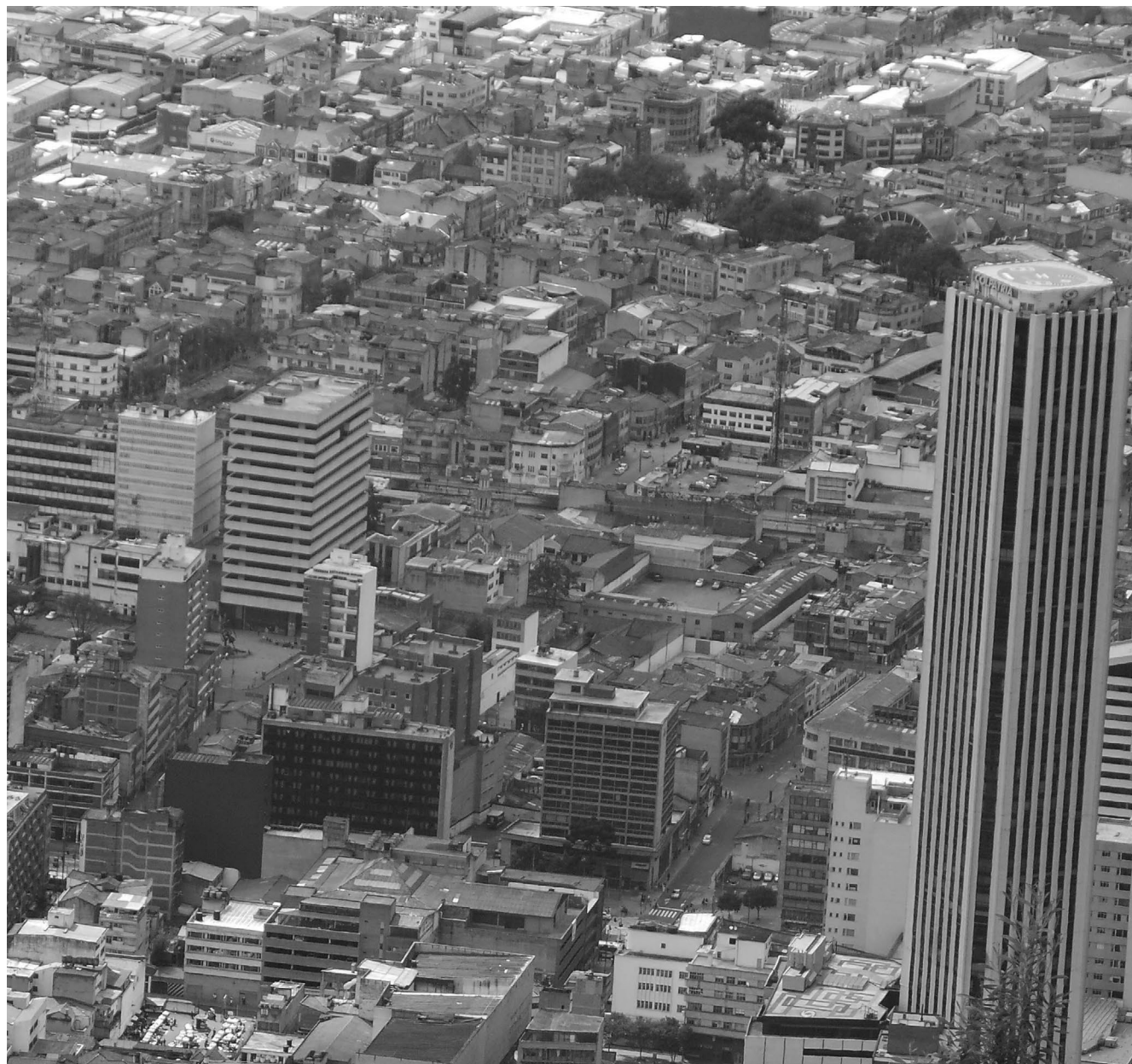
El complejo tejido urbano incuba un cúmulo de violencias que envuelven la vida cotidiana y trastocan las relaciones sociales.

irrumpe como una fuerza contraria. La violencia erosiona la ciudadanía, pues los habitantes, las víctimas, modifican su conducta cotidiana: cambian horarios, modifican rutas y espacios de tránsito, restringen las relaciones sociales por miedo al desconocido, etcétera. 7