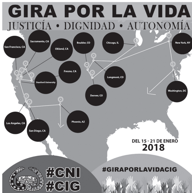
IMAGEN 4 «Gira por la vida»

Fuente: Facebook «Apoyo al CIG al norte del muro».