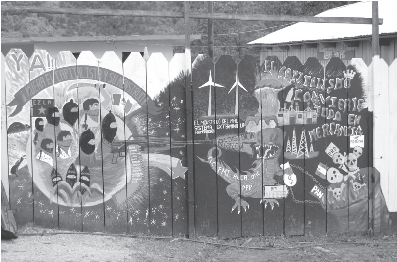
Mural en el Caracol de Morelia, 15 de octubre de 2017.